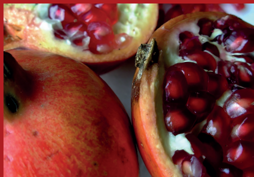
Jednym z noworocznych greckich obyczajów jest rozbijanie owocu granatu na progu domu. Pestki owocu rozsypują się, a ich mnogość symbolizuje obfitość szczęścia i powodzenia, które w nowym roku mają spłynąć na dom i jego mieszkańców (inaquim/CC BY-SA 2.5)

Nasze studia nie skupiają się tylko na nauce języka i na literaturze. Traktujemy język nowogrecki i teksty zapisane w tym języku, szczególnie literackie, również jako bramy do poznania Grecji i Greków. Dlatego wiele zajęć dotyczy życia we współczesnej Grecji: jej historii, topografii, różnorodności regionalnej, problematyki społecznej i politycznej, sztuki kulinarnej oraz obyczajowości, łączącej w harmonijnych proporcjach Wschód z Zachodem.