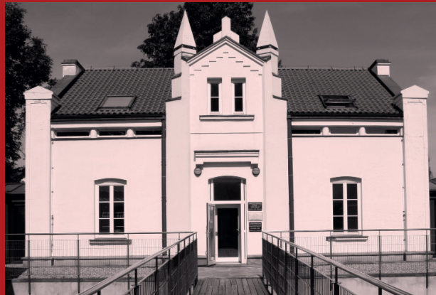
Biała Willa (ul. Dobra 72). 150 m od Biblioteki Uniwersyteckiej

Wydział „Artes Liberales” to jednostka Uniwersytetu Warszawskiego, łącząca działalność edukacyjną z pracą naukową. Patronuje nam idea sztuk wyzwolonych – artes liberales , a więc dyscyplin, które już w starożytności uważano za godne człowieka wolnego. Proponujemy kandydatom wszechstronne wykształcenie humanistyczne z otwarciem na inne dziedziny wiedzy. Pragniemy, by nasi absolwenci byli ludźmi niezależnymi w swoich poglądach, mającymi odwagę wyrażać własne zdanie z poszanowaniem i zrozumieniem odmiennych opinii.