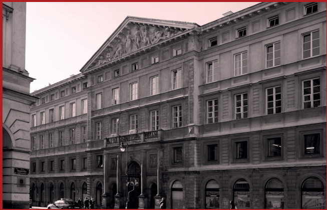
Pałac Zamoyskich (ul. Nowy Świat 69). 200 m od Kampusu Głównego UW